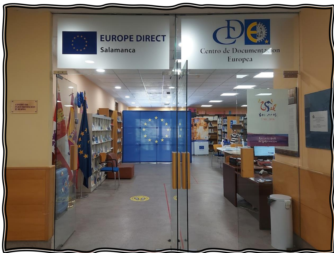
Centro de Documentación Europea de la Universidad de Salamanca