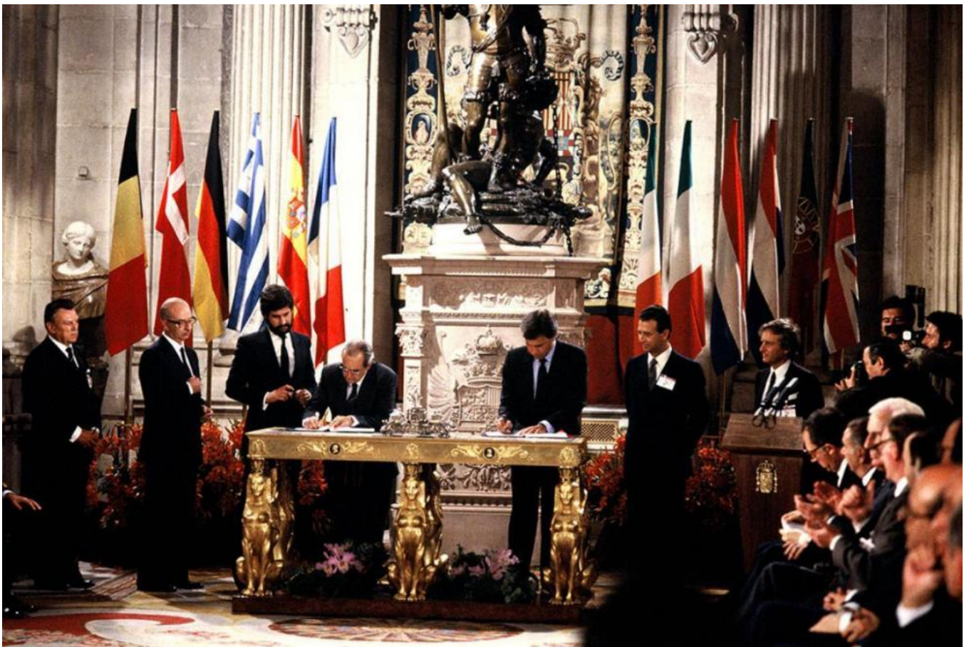
Felipe González, Presidente español; Fernando Morán, ministro de Exteriores; y Manuel Marín, secretario de Estado, durante la firma del Tratado de Adhesión de España el 12 de junio de 1985 en Madrid