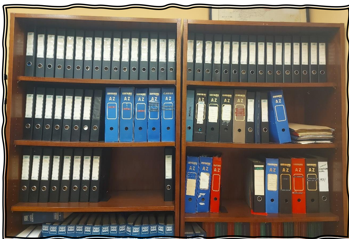
Documentación al inicio de los trabajos de descripción

Por decisión del Equipo de Gobierno de la Universidad de Salamanca, el Archivo Manuel Marín se encuentra ubicado en su Centro de Documentación Europea, que se ha ocupado de la clasificación y ordenación del fondo y en cuya sede situada en el Campus Miguel de Unamuno puede ser consultado.